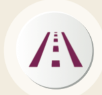
عناصر السلامة على الطرق