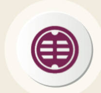
مناهيل مسبقة الصب