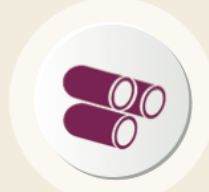
أنابيب الخرسانية مسبقة الصب