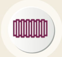
أنابيب كابلات النقل الذكي